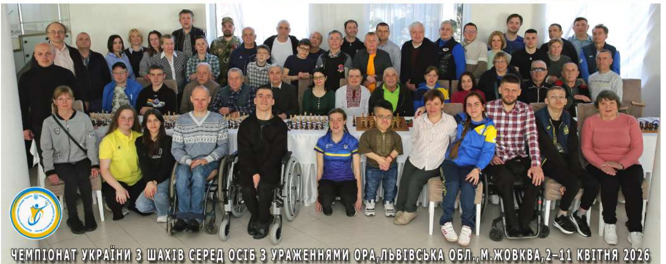
ЧЕМПІОНАТ УКРАЇНИ З ШАХІВ СЕРЕД ОСІБ З УРАЖЕННЯМИ ОРА, ЛЬВІВСЬКА ОБЛ., М. ЖОВКВА, 2-11 КВІТНЯ 2026